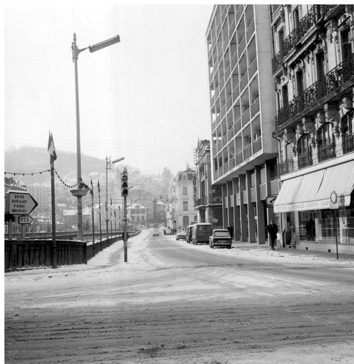
Le quai de la République sous la neige (janvier 1971 - archives départementales de la Corrèze, 23fi/32455/3)