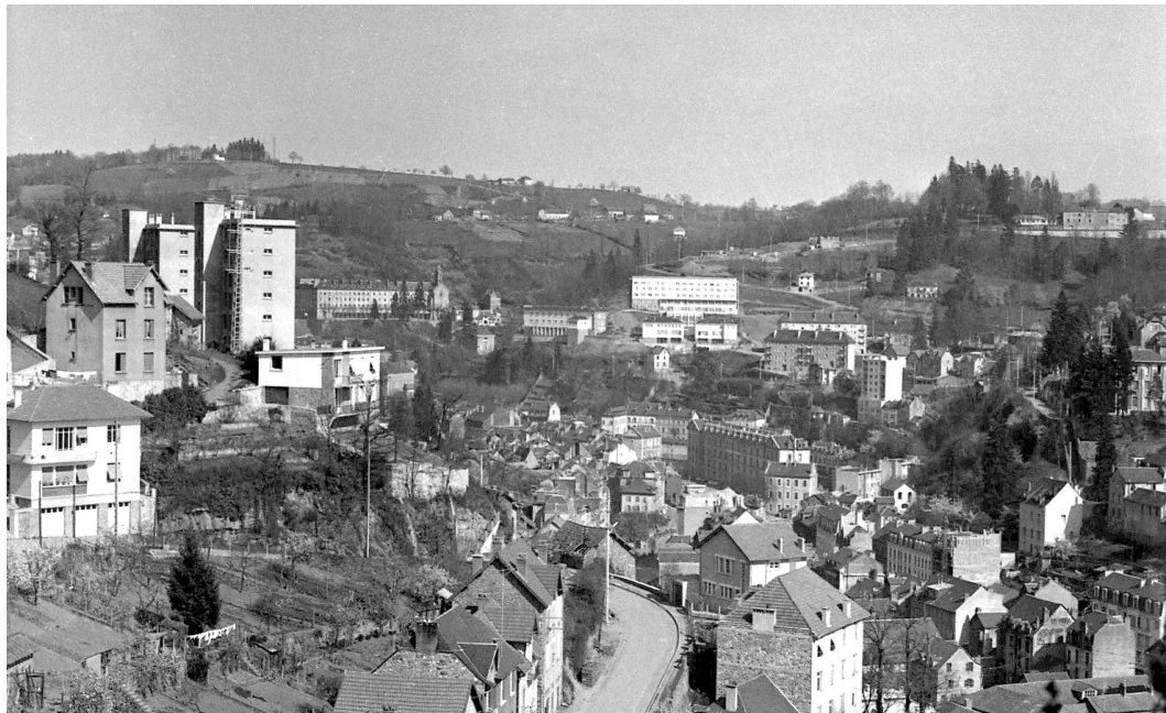
Vue sur le Champ-de-Mars (place Martial Brigouleix) (27/03/1961 - 10fi629/3/4/)

Alors que la France sort dévastée de la Seconde Guerre Mondiale, la reconstruction s'engage. Une période prospère s'ouvre : les Trente Glorieuses. Les financements sont plus faciles à obtenir. Il existe de nouveaux besoins dans le secteur tertiaire. Dans ce contexte, la modernisation des services administratifs est un objectif national et leur regroupement en un seul et même lieu est privilégié.